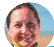
CATHERINE, 44 ANS

« Nos prêtres nous apportent beaucoup et donnent beaucoup de leur temps pour nous accompagner et être disponibles dans tous les moments. Pour les soutenir dans leur mission, je donne au Denier. »